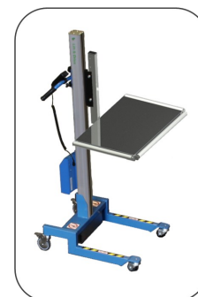
Flak, rulle 3 sidor