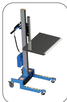
Flak, rulle fram