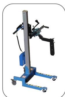
Expand & Turn