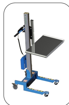
Flak, rulle sidor